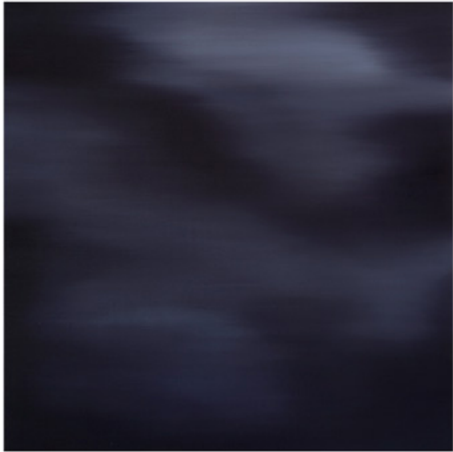
夢(一) [Somnium (i)]