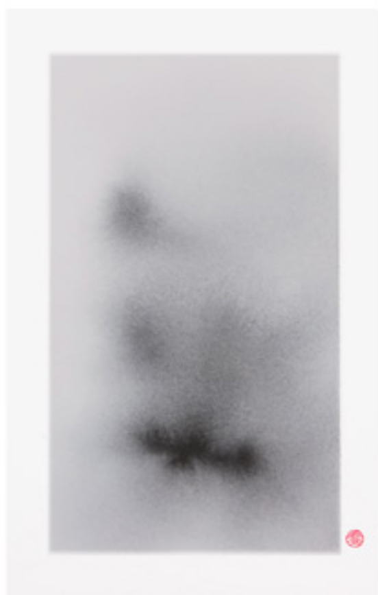
源 (十) [Origins (x)] Ink on watercolour paper 27.5 x 18.5 cm , 2013