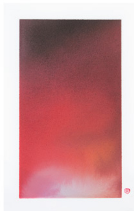
源 (十二) [Origins (xii)] Ink on watercolour paper 27.5 x 18.5 cm , 2013