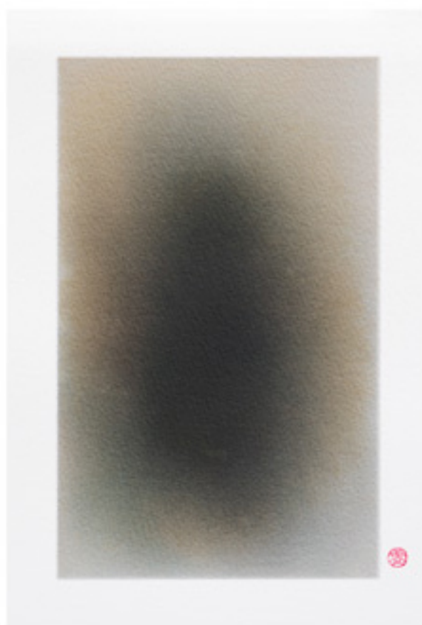
源 (二十三) [Origins (xxiii)] Ink on watercolour paper 27.5 x 19 cm , 2013